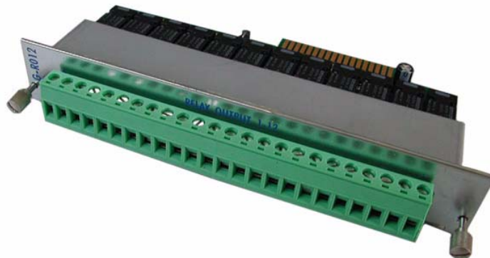
Figura 1 : Scheda G-RO12 - 12 uscite relè