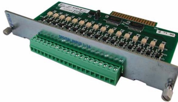
Figura 1 : Scheda G-DI16 - 16 ingressi digitali