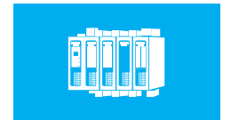
MPK and/or CNI-VIPA