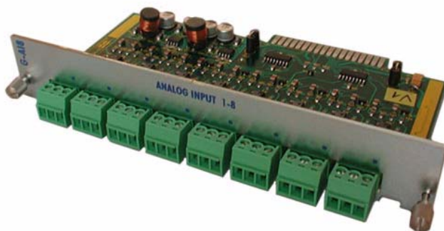
Figura 1 : Modulo G-AI8 - Modulo 8 ingressi analogici a 10 bit per sistema GPU/RPU.